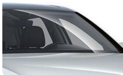
フロントガラス 損害補償