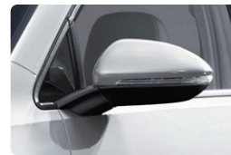
ドアミラー 損害補償