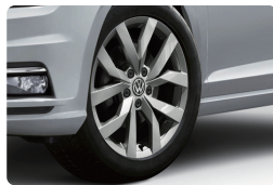
タイヤパンク 損害補償 初度登録から3年間