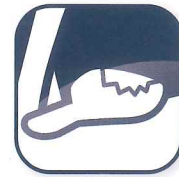
ドアミラー 損害補償