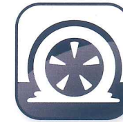
タイヤパンク 損害補償