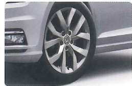
タイヤパンク 損害補償