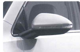
ドアミラー 損害補償