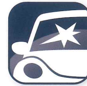
フロントガラス 損害補償

フォルクスワーゲン自動車保険プラスには、フロントガラス・タイヤパンク・ドアミラーの損害を補償する「フォルクスワーゲン プレミアムケア」が無償で付帯されます。 しかも「フォルクスワーゲン プレミアムケア」を利用しても、自動車保険を使わなければノンフリート等級には影響しません。