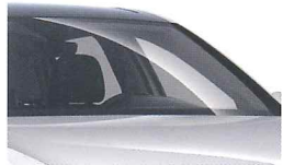
フロントガラス 損害補償