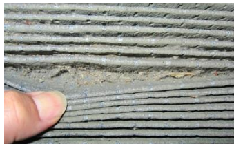
ゴミでフィルターが目詰まりします

交換時期 お車の使用状況にもよりますが、 最長で2年、3万キロ以内での交換がお勧めです。