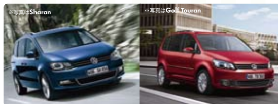
DSG®トランスミッション