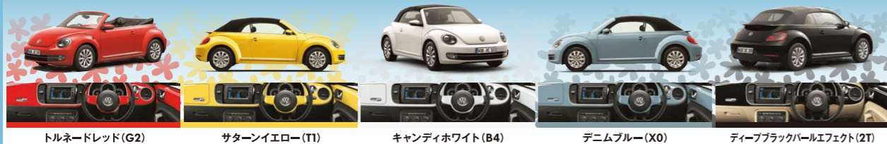
トルネードレッド(G2) サターンイエロー(T1) キャンディホワイト(B4) デニムブルー(X0) ディープブラックパールエフェクト(ZT)