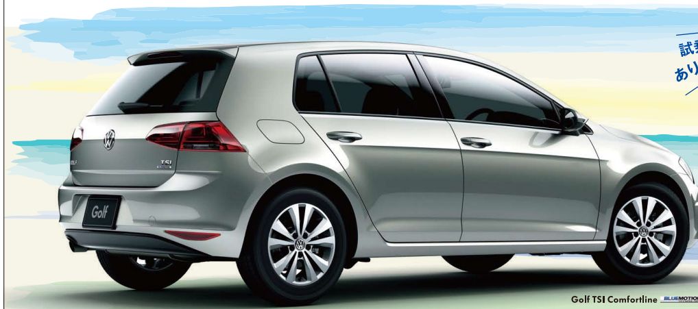
Golf TSI Comfortline BLUEMOTION