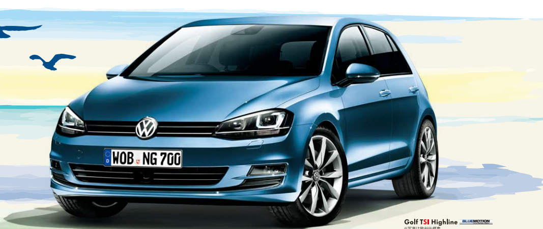
Golf TSI Highline BLUEMOTION