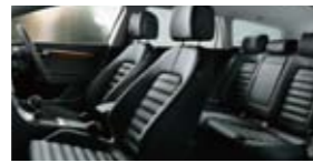
ナバレザースポーツシート