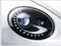
バイキセノンヘッドライト *Design Leather Packageに標準装備、Designにオプション。