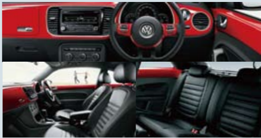
インテリア(本革仕様スポーツシート&ボディカラー同色パネル)