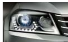
バイキセノンヘッドライト オートハイトコントロール機能付

あらゆる道で上質なドライビングフィールを堪能できるオールラウンドプレミアムワゴン Passat Alltrack 誕生。