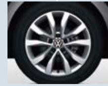
7Jx17アルミホイール (Design Leather Package)