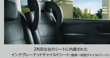
2列目左右のシートに内蔵されたインテグレートドチャイルドシート(後座一体型チャイルドシート)