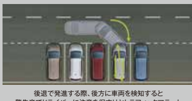
後退で発進する際、後方に車両を検知すると警告音でドライバーに注意を促すリヤトラフィックアラート