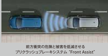
前方衝突の危険と被害を低減させるフリクラッシュブレーキシステム「Front Assist」

New Sharan TSI Trendline 車両本体価格 3,600,000円 4ドア 6速DSG® 右ハンドル 燃料消費率 JC08モード 15.0km/L TSI Comfortline 車両本体価格 3,940,000円 TSI Highline 車両本体価格 4,630,000円