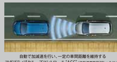
自動で加減速を行い、一定の車間距離を維持するアダプティブクルーズコントロール「ACC」(作動速度範囲30km/h以上)